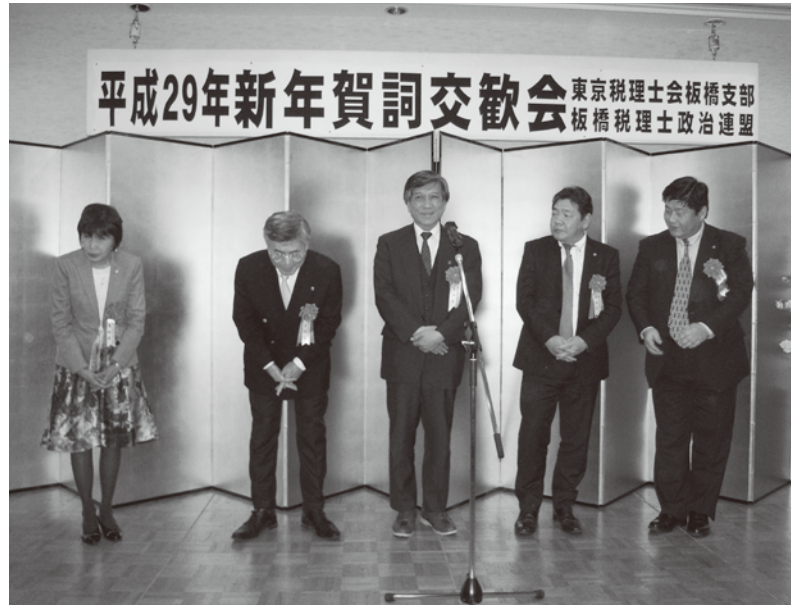
第6ブロック各支部長挨拶