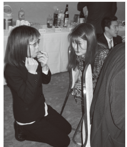
あの案件は内緒ね。