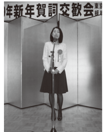
丹羽恵玲奈 板橋都税事務所長