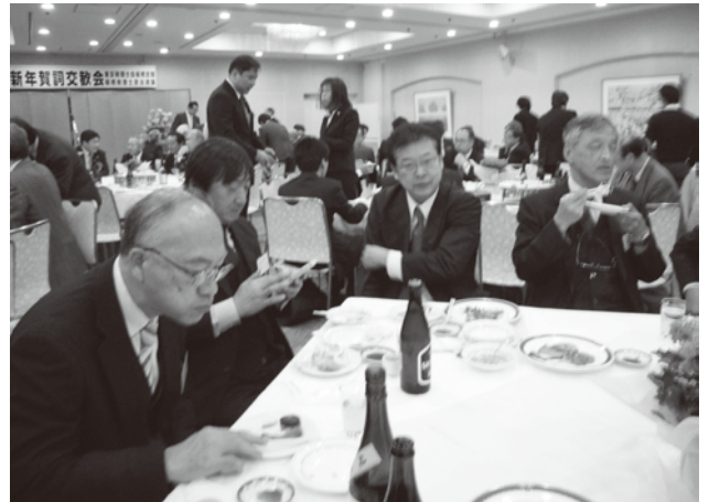
うまい！！写真を撮っておこう。