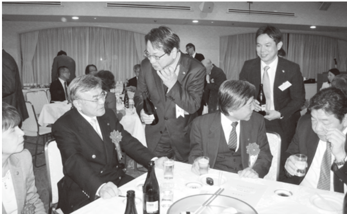
本日のご参加ありがとうございます。