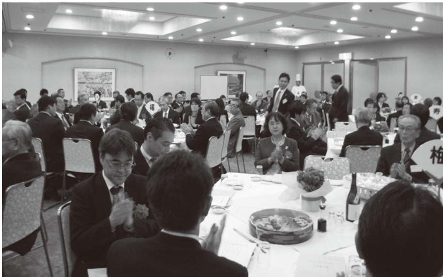
盛大！どこに写っているかな？