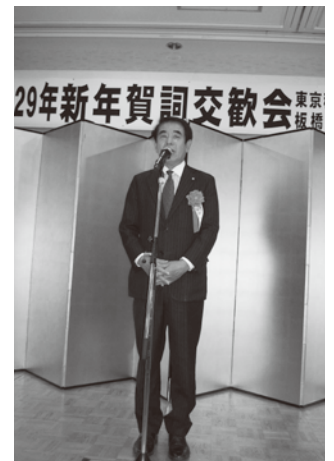
下村博文衆議院議員