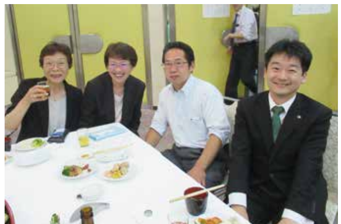
▲皆様 いい笑顔です