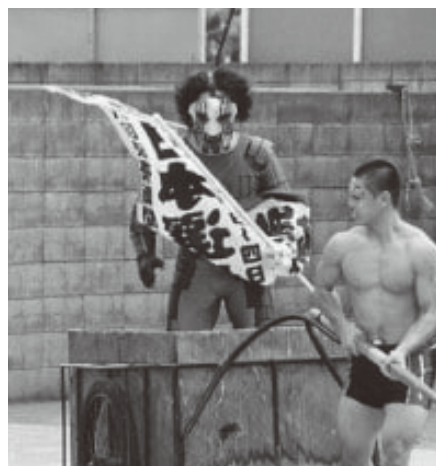
19歳の頃の筆者(手前)▶

プロレスが好きな方がいらっしゃいましたらプロレス談議に花を咲かせたいと思います。是非お声がけ下さいませ。