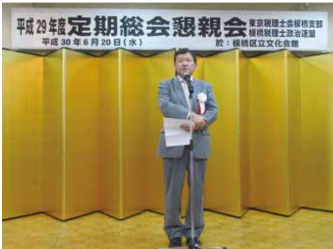
▲有働支部長の挨拶です