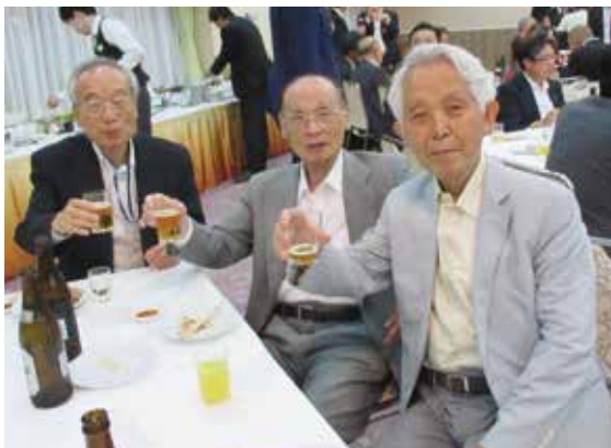
▲今年の総会も無事終わりましたね