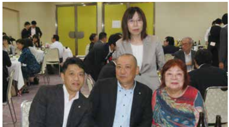
▲総会お疲れ様でした!