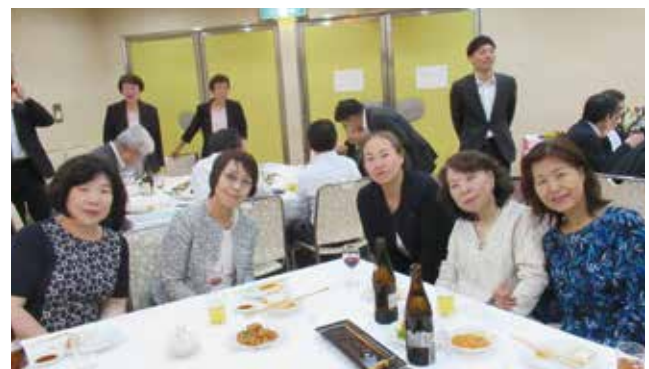
▲和やかなムードでパシャ