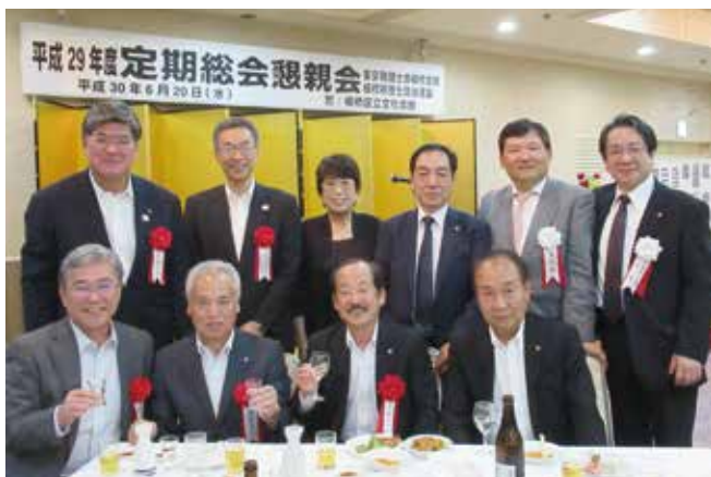
◀みなさんお揃いです