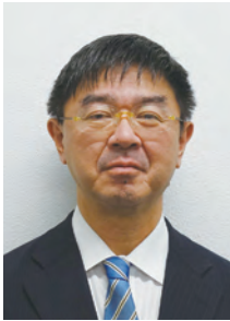
板橋都税事務所長 蓮沼 正史

あけましておめでとうございます。令和8年の幕開けにあたり、東京税理士会板橋支部の皆さまに謹んで新年のご挨拶を申し上げます。