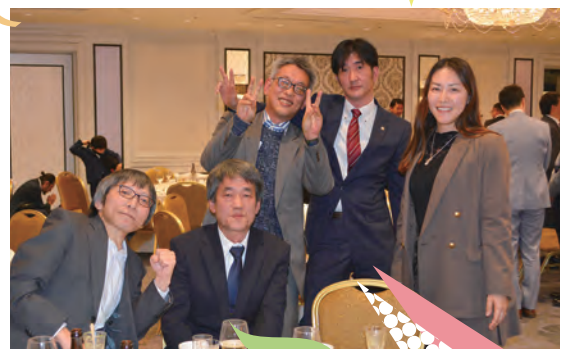
忘年会 令和7年12月3日 於:ホテルメトロポリタン池袋