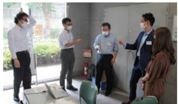
▲縁の下の力持ち、総務部