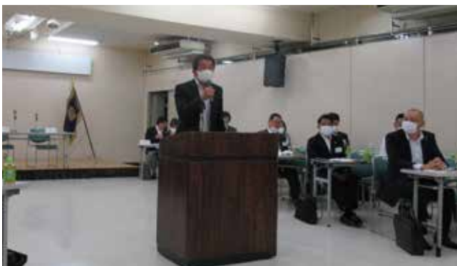
▲コロナ禍の総会も滞りなく閉会