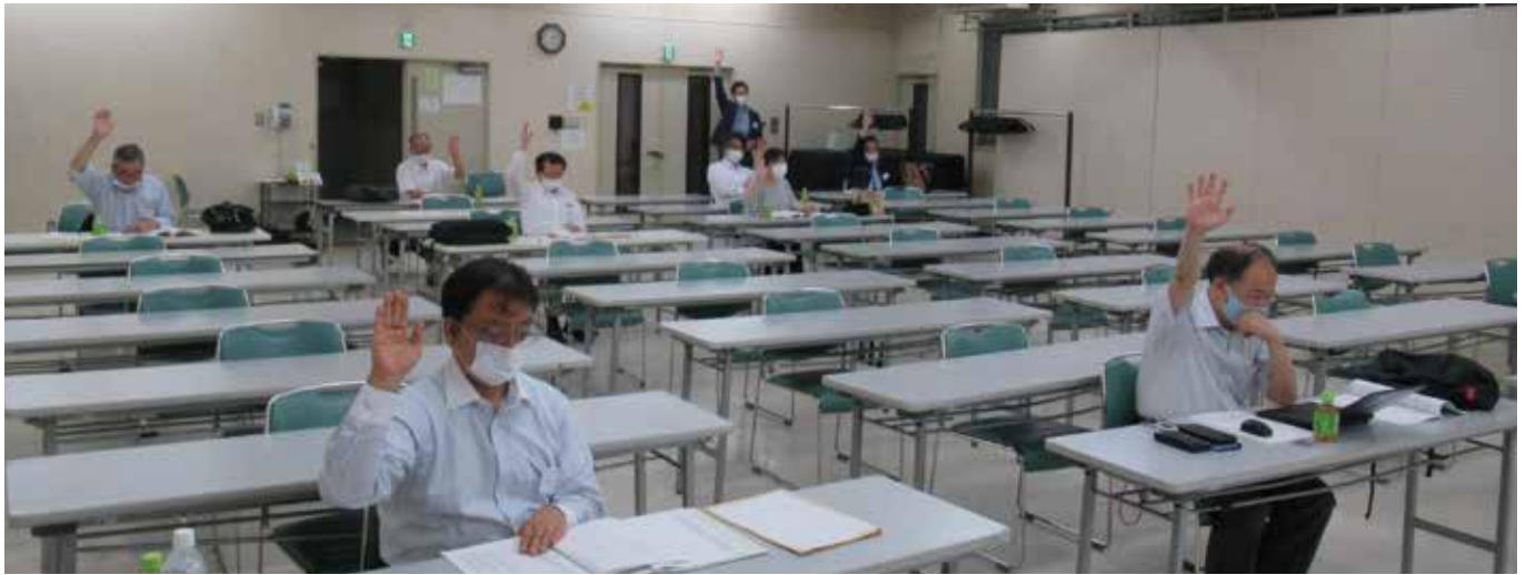
▲前年に引き続き、ソーシャルディスタンス