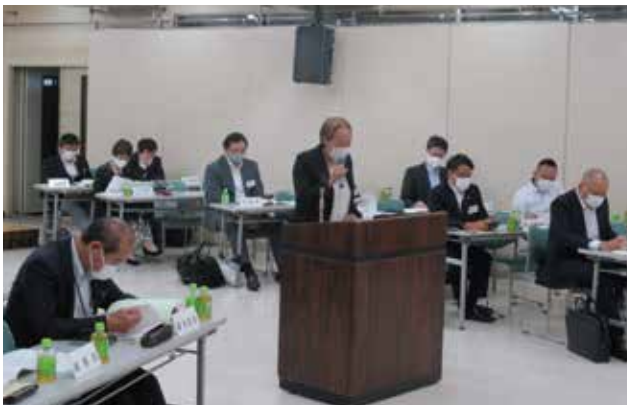
▲経理部より報告です