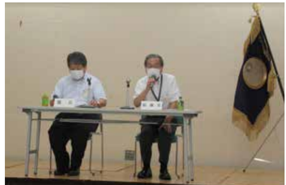
▲順調な議事進行です