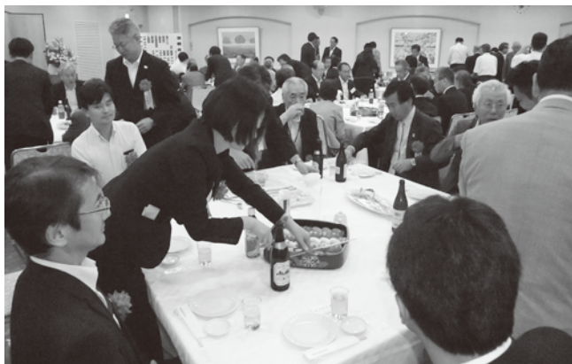
▼和やかムードです▼