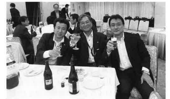
▲ カメラに向かってカンパイ!