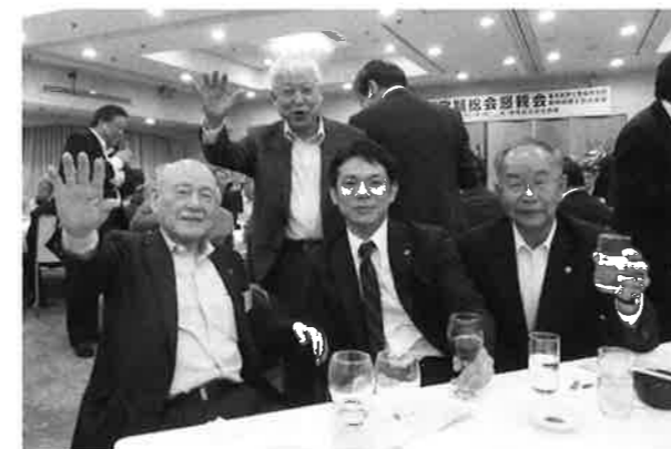
▲ 和やかなムードで