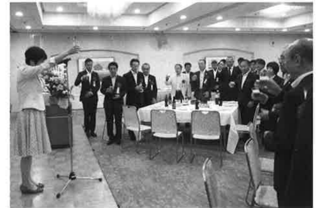
▲ 懇親会の始まりです