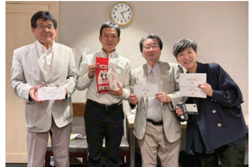
支部長を囲む入賞した3名の皆様▼