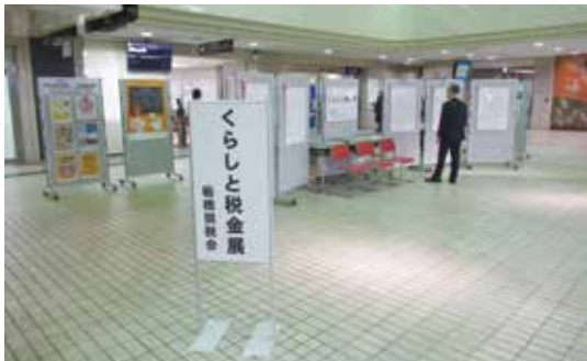
くらしと税金展 規模を縮小し開催