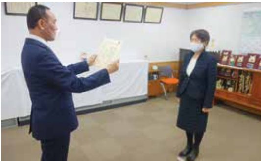
税務功労者感謝状贈呈