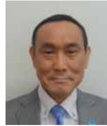
板橋都税事務所長

発展と、会員の皆様のご健勝並びに事業のご繁栄を心から祈念いたしまして、新年のご挨拶とさせていただきます。