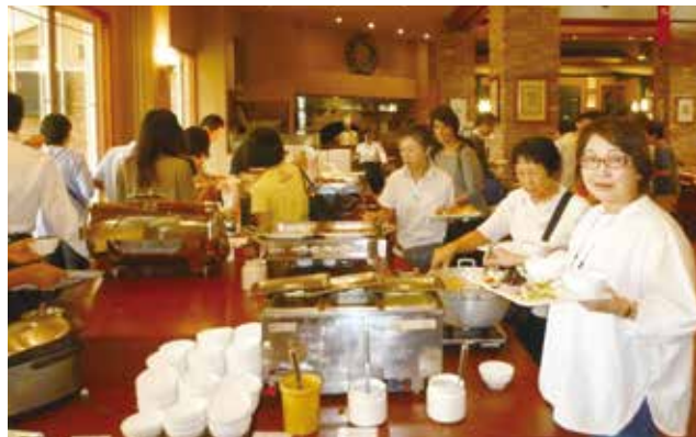
▲楽しい昼食風景(地ビールレストラン「シルバンズ」にて)