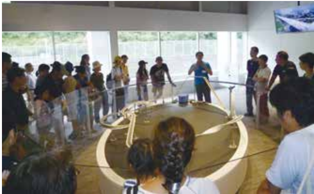
▲超電導リニアの仕組み

その後は道の駅に寄って、最後にリニア見学センターに行きました。1階には試験車両の実物の展示がされていて、車掌さんの恰好をして写真を撮ることもできました。2階では磁力浮上、磁力走行を体験できるミニリニアに乗ったり、リニアモーターカーの走行試験を見ることができました。実際に見たリニアモーターカーは新幹線とは比べ物にならないくらいのスピードで、ゴーツという物凄い音を立ててあっという間に目の前を通り過ぎて行きました。すごい迫力で大変興奮しました。交通事情により、富士山五合目の見学に行けなかったのは残念でしたが、大変有意義なバス旅行でした。