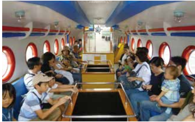
▲遊覧船「もぐらん」船内