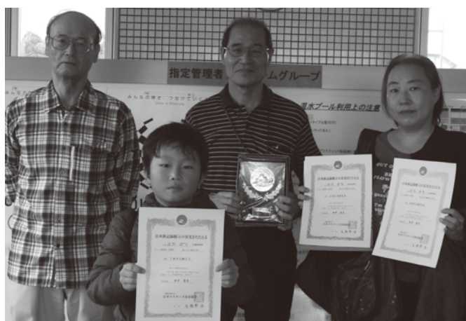
▲レインボーカップ表彰

水泳同好会は月1回、土曜日に練習会を開催しています。区民体育大会の他にも大会に参加していますので、大会を目指すのでも、休日に家族サービス代わりに子ども連れでプールで遊ぶのでも、またダイエットのためでも良いので、是非一度覗いてみてください!