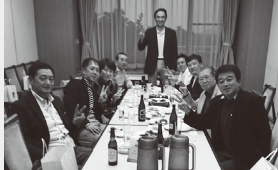
▲ゴルフの後はおいしく乾杯!

平成29年10月16日、高根カントリークラブゴルフ場において板橋支部ゴルフコンペが開催されました。