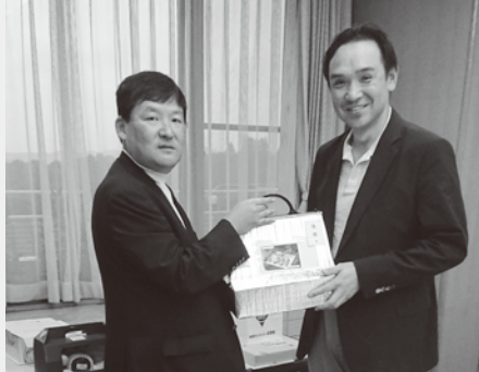
▲おめでとうございます