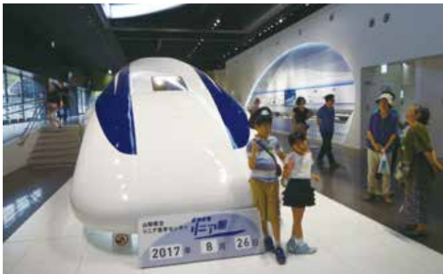
▲リニアの試験車両