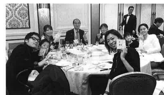
みなさん。ハイポーズ