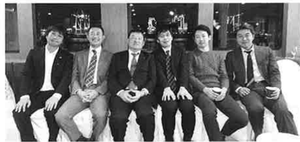
交流が出来て良かった!!