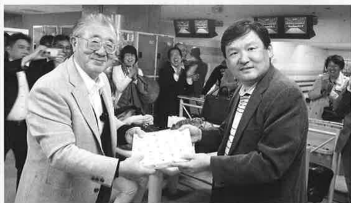
おめでとうございまー！