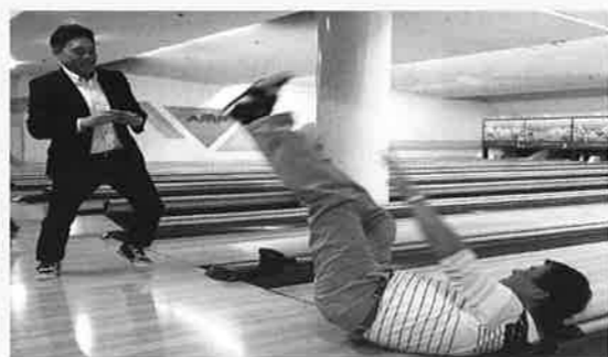
スゴい始球式でした！