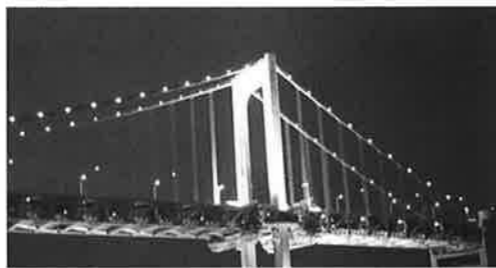
ベイブリッジを望む

加えて今年から西川口支部も参加することになり、今後も益々他支部青年部との交流が深まっていくことと思いますので、残念ながら今回はご参加頂けなかった先生方も次回以降ご参加頂ければ幸いです。