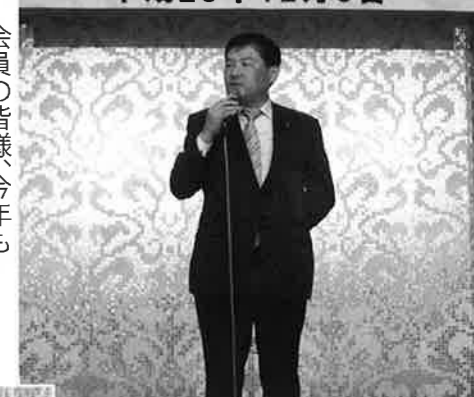
会員の皆様、今年もありがとうございました。