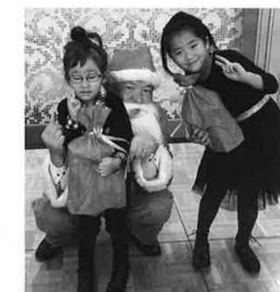
サンタさん!?プレゼントありがとう。