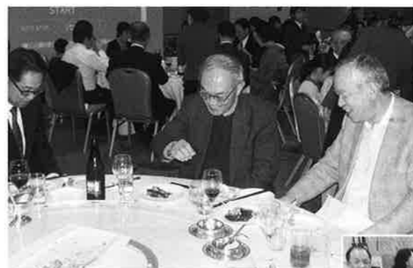
あんな事もあったな！