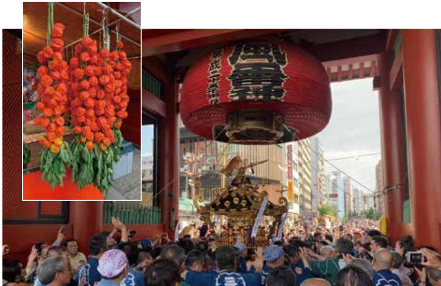
「浅草三社祭とほおずき市」